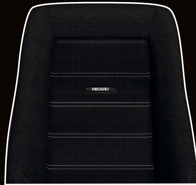
Leder schwarz/Wüfelcord schwarz