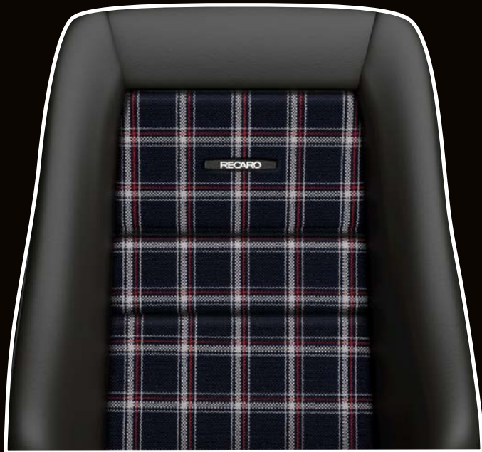
Leder schwarz/Stoff Karo