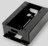
RECARO Konsole inkl. Car Kit