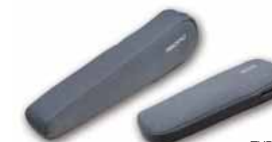
TYPE-EN Nardo Gray