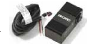
ナビシートセクター

※取り付けに際しては、専門的な知識が必要となりますので、RECARO正規取扱販売店にご相談ください。