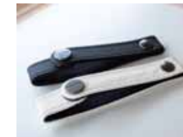
ベルトストラップ黒 1800014J ベルトストラップ白 1800015J ¥5,060 メーカー希望小売価格(税込)