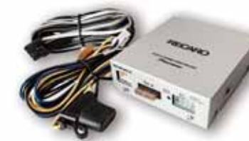
■専用ハイダウエイアンプ(付属)

※MAZDAのRoadster(型式ND)の純正オーディオ付き車両(BOSE除く)に装着する場合には、カプラーオンでヘッドレストスピーカー配線を取り出す専用スピーカーハーネスが必要となります(別売)。