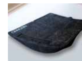
ハイトアジャストパッド 1800013J ¥9,900 メーカー希望小売価格(税込)