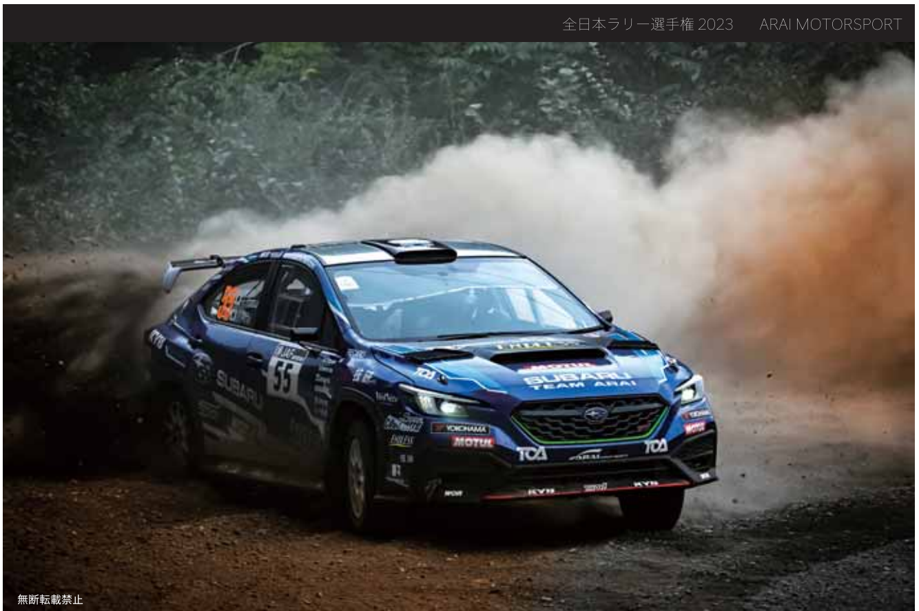
全日本ラリー選手権 2023 ARAI MOTORSPORT