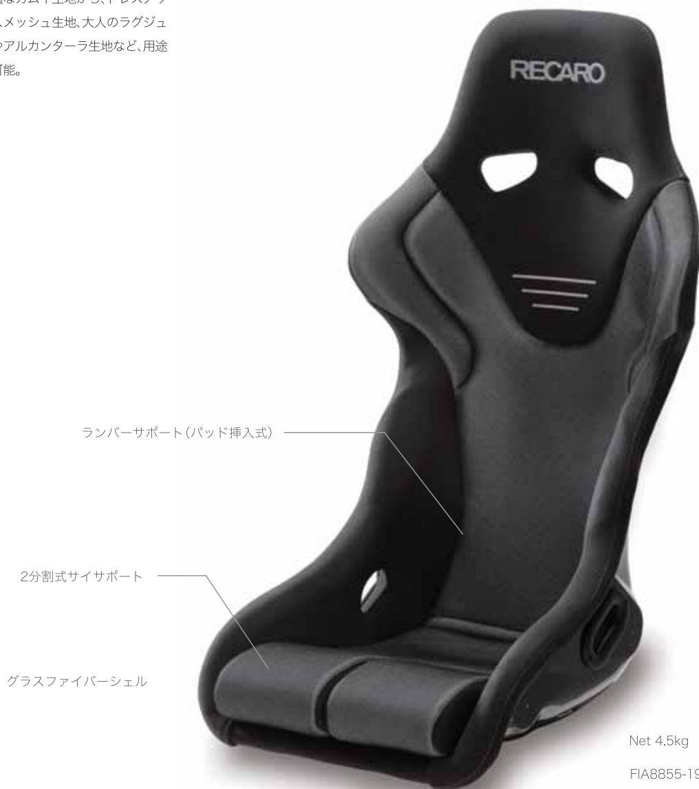
RS-G GK Black x Silver

スポーツドライビングに最適なカムイ生地から、ドレスアップ向けに揃えた4色のグラスメッシュ生地、大人のラグジュアリーさを演出するレザーやアルカンターラ生地など、用途に合わせたモデルの選択が可能。