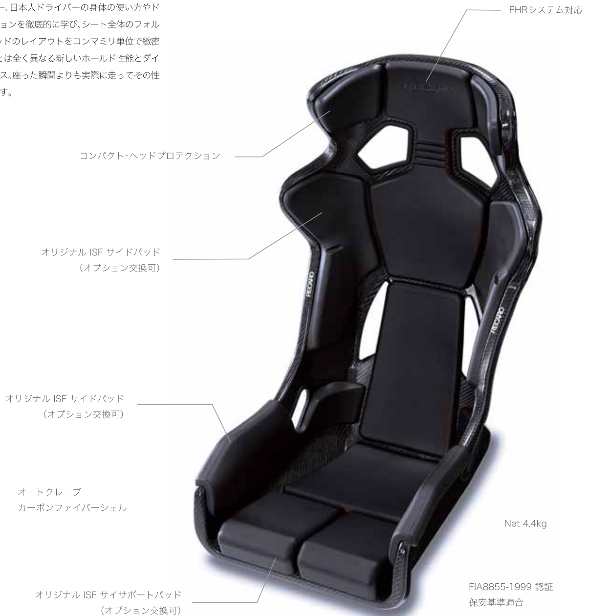
PRO RACER RMS 2600A

RECAROの設計思想を正常進化させるゼロ開発のコンセプトに基づき、田中哲也選手・脇阪寿一選手・新井敏弘選手。さらに佐々木孝太選手や羽根幸浩選手・井口卓人選手や久保凛太郎選手ら多くのプロドライバーの意見を開発に取り入れながら、サーキットでのテスト走行を繰り返して開発しました。プロドライバー、日本人ドライバーの身体の使い方やドライビングポジションを徹底的に学び、シート全体のフォルムと新素材ISFパッドのレイアウトをコンマミリ単位で緻密に設計。これまでとは全く異なる新しいホールド性能とダイレクトなレスポンス。座った瞬間よりも実際に走ってその性能の高さに驚きます。